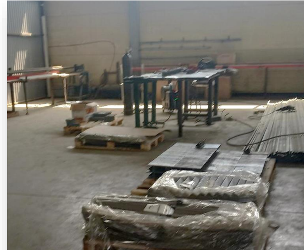
До начала проекта