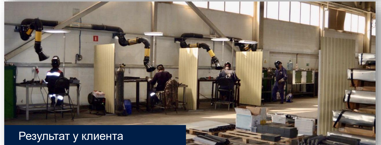
Результат у клиента